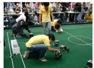
In der Halbzeitpause des Small-Size-Finales wechselt das thailändische Team in Wadeselle die Batterien der Roboter.