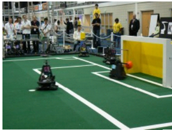
Die CoPS verwandeln einen Strafstoß gegen Hibikino-Musashi.

oder Juniorwettbewerbe waren in andere Gebäude ausgelagert, zu denen man bis zu einer halben Stunde unterwegs war. Eine solche Zerrissenheit tut dem RoboCup nicht gut, schließlich ist es gerade der ungezwungene Austausch auch zwischen den verschiedenen Ligen, der den besonderen Reiz der Veranstaltung ausmacht. Völlig unverständlich ist es, warum gerade neue Ligen wie Nanogram Demonstration und Physical Visualization, die den Anschluss an die RoboCup-Gemeinde erst noch finden müssen, so weit abseits untergebracht waren.