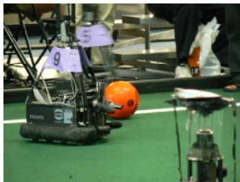
Ein Tribot bereitet sich auf einen Einwurf vor

Spannender war das Spiel um den dritten Platz, bei dem die CoPS (Uni Stuttgart) zunächst 0:1 gegen Hibikino-Musashi aus Japan in Rückstand gerieten, aber rechtzeitig den Ausgleich schafften und so die Entscheidung durch Strafstoße erzwingen. Richtig glücklich wirkten die Stuttgarter nicht über diesen Verlauf, schließlich waren sie am Vortag bei den Strafstoßen gegen Eigen unterlegen. Inzwischen war aber das Verhalten des Torwarts verbessert worden, Hibikino-Musashi konnte nur zwei Strafstoße verwandeln. Danach war Stuttgart dran. Der erste Schuss war kraftlos und sah eher wie ein Anstoß aus. Möglicherweise war ein falscher Befehl gegeben worden. Die anschließenden Strafstoße waren dafür umso sicherer und gingen alle rein. Beim dritten Treffer wurde das Spiel abgebrochen. Erleichterung bei den CoPS, denen bei einer Niederlage wohl ansonsten ein Motivationsstief bevorgestanden hätte.